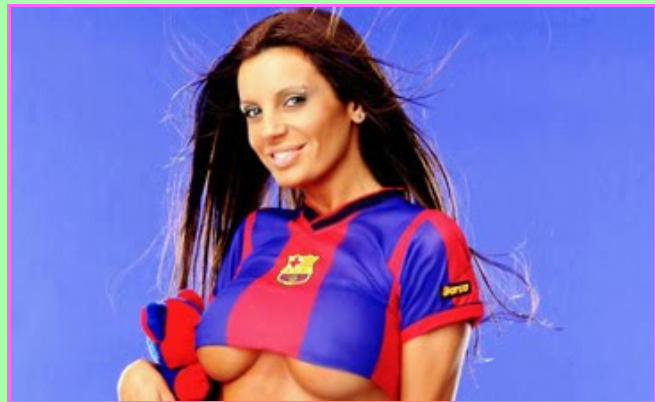
Sabía que tarde o temprano haría Historia

El otro día hablaba de las chicas sin novio, un invento musical perpetrado para atraer a esa parte del público femenino que pasan sus tardes suspirando y haciendo macramé. Al hablar de ellas, no se puede obviar el fenómeno contrario. Porque todo ying tiene su yang, toda Carolina Ferré, su Pilar Rubio. Mientras que las chicas sin novio tienen que usar su feísmo y sus letras ñoñas para encandilar a su público, hay un tipo de chicas que tan sólo tienen que comérselas dobladas para triunfar en el mundo del showbusiness. Hoy presentamos: "Chicas que se las comen dobladas" (o "El efecto Monroy")